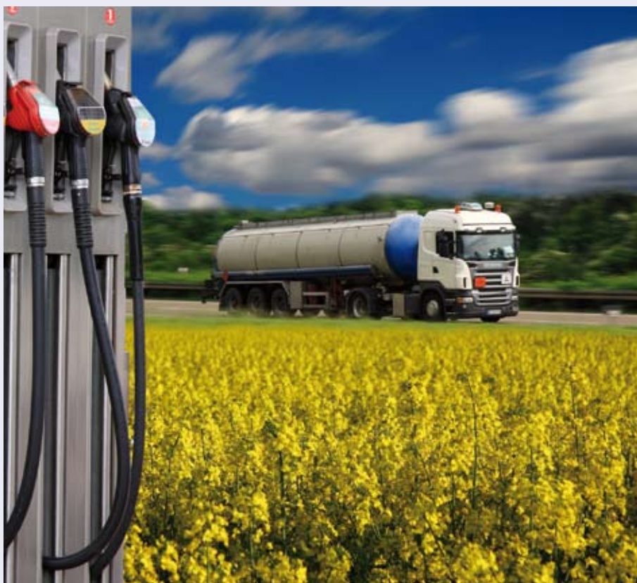
Für die mobile Anwendung von Wasserstoff bietet die TÜV NORD Gruppe Automobilherstellern und -zulieferern umfangreiche Beratungs-, Prüf- und Zertifizierungsleistungen an. Durch Vernetzung ihres Fachwissens ist TÜV NORD Industrieberatung ein kompetenter Partner rund um Erzeugung, Speicherung, Transport und Nutzung von Wasserstoff.

die Dichtheit von Manschetten und der Ölwanne prüfen. Bei der Untersuchung des Motormanagement- und Abgasreinigungssystems im Rahmen der HU geht es auch, aber nicht nur, um die Umwelt. Ein übermäßiger Schadstoffausstoß kann beispielsweise auf einen Defekt am Fahrzeug hinweisen, der übermäßig viel Kraftstoff kostet.