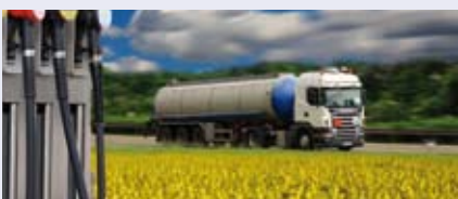
Mit Wasserstoff den Verkehr klimafreundlicher machen.

Die TÜV NORD Gruppe zertifiziert neben anderen Produkten und Dienstleistungen klimaneutrales Reisen und erstellt Ökobilanzen für die Automobilindustrie. Die TÜV NORD Industrieberatung nimmt durch Vernetzung ihres Fachwissens rund um Erzeugung, Speicherung, Transport und Nutzung von Wasserstoff