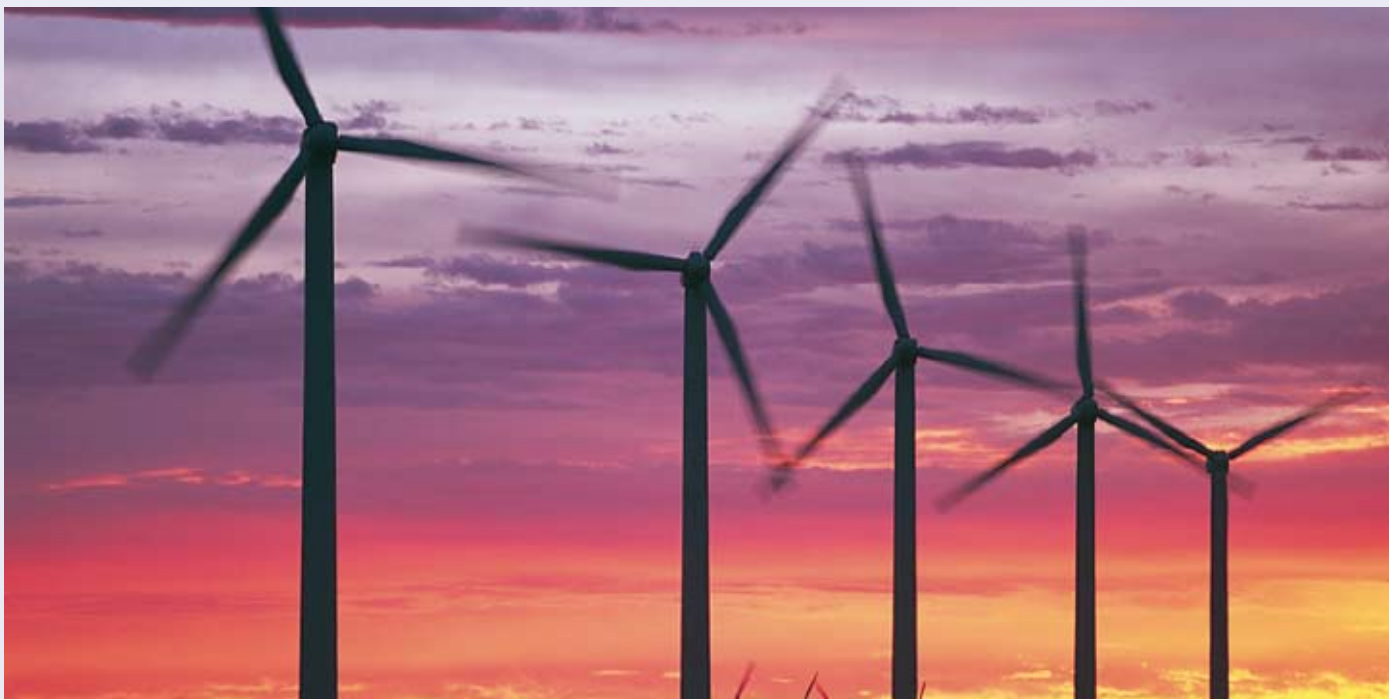
Fachleute der TÜV NORD Gruppe begleiten Windkraftanlagen während ihres ganzen Lebenszyklus.

Auch die Windenergieanlagen-Betreiber mit ihren technisch hochentwickelten Anlagen operieren innerhalb gesetzlicher und politischer Rahmenbedingungen. Damit diese Unternehmen wirtschaftlich und effizient Strom produzieren, unterstützen Fachleute der TÜV NORD Gruppe bei der Zertifizierung, Einzelprüfung und Typenprüfung nach deutschen und internationalen Richtlinien bis hin zur Standortbeurteilung sowie der Bauüberwachung, dem Betrieb und der Instandhaltung.