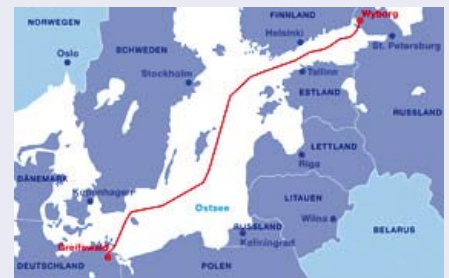
Das erste Erdgas soll Ende 2011 durch die neue Pipeline fließen.

Zwei jeweils 1.210 Kilometer lange, in der Ostsee verlegte Pipelines werden Greifswald mit Wyborg an der russischen Küste verbinden und damit Europa an die weltweit größten Gasreserven direkt anbinden.