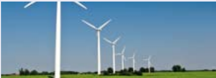
Windenergie soll im Jahr 2020 ein Viertel des deutschen Strombedarfs decken.

Das spezielle Know-how der TÜV NORD Gruppe bei erneuerbaren Energien zeigt sich insbesondere in ihrer umfangreichen und langjährigen Erfahrung auf den Gebieten Windenergie und Biogasanlagen sowie in der Wasserstofftechnologie. Das Zertifikat Ökostrom von TÜV NORD CERT