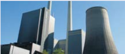
2014 soll das erste 700°-Kraftwerk in die Erprobung gehen.

In Deutschland wird es in den kommenden 20 Jahren viele Kraftwerksneubauten geben, um alte und aus heutiger Sicht ineffiziente Kraftwerke abschalten zu können und gleichzeitig den Energiebedarf sicherzustellen. Dabei werden CO 2 -Emissionen erheblich verringert, da der Ersatz eines Altkraftwerks durch ein Kraftwerk der 600°-Technologie schon zu einer Verringerung der CO 2 -Emissionen um etwa 35 Prozent führt. Darüber hinaus werden Kraftwerke der 700°-Technologie mit Wirkungsgraden von über 50 Prozent sowie unterschiedliche Verfahren der CO 2 -Abscheidung und -Speicherung entwickelt.