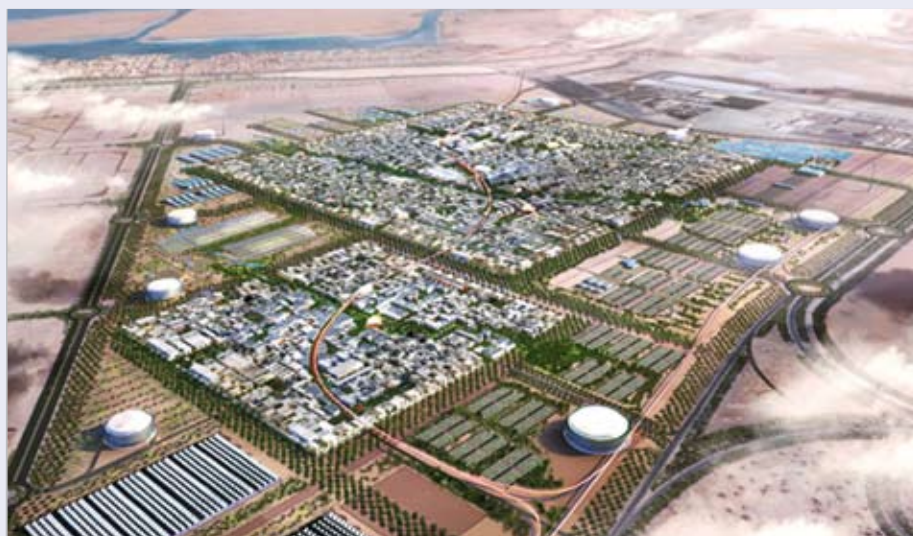
Masdar wird die weltweit erste CO 2 -neutrale, abfall- und autofreie Stadt.

TÜV Middle East entwickelt ein integriertes Managementsystem für die erste grüne Stadt nach Normen für Qualitäts-, Umwelt- und Arbeitsschutzmanagementsysteme nach ISO 9001, ISO 14001 und OHSAS 18001. Die TÜV NORD Gruppe wird Masdar-Mitarbeiter und -Führungskräfte in Seminaren mit dem integrierten Managementsystem vertraut machen sowie bei der Einführung und der Prüfung unterstützen.